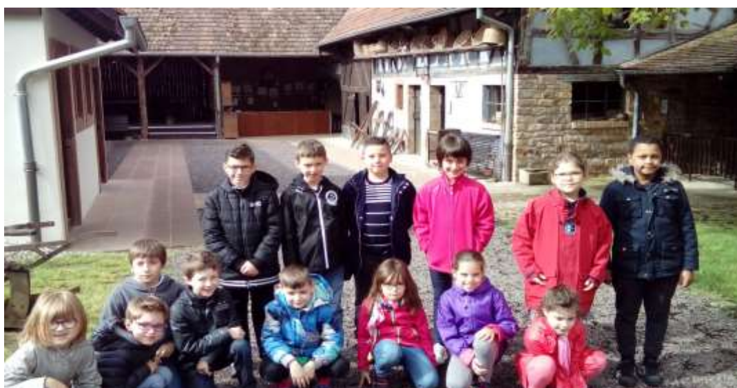
C'était génial !!!

A la fin, on a fait le jeu du « Quizz » et on a découvert les salles à l'étage.